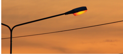
Lichten doven als besparingsoperatie p. 3