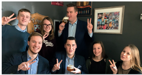
Jong en interesse in politiek? (pag. 2)