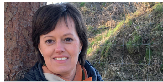
Een breder armoedebestrijdingsbeleid nodig. (pag. 3)