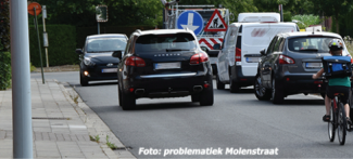
Foto: problematiek Molenstraat

U kan een probleem naar een hogere plaats op de lijst stemmen, een oplossing voorstellen of uw vrienden en kennissen om