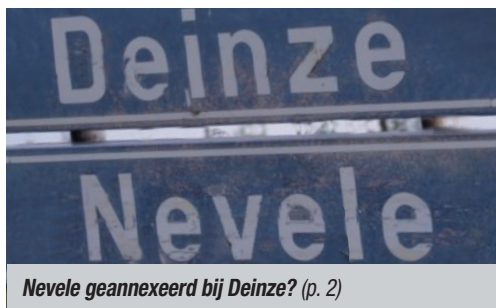
Nevele geannexeerd bij Deinze? (p. 2)

Op naar een veiligere omgeving voor alle deelnemers aan het verkeer, niet enkel in het centrum maar ook in alle deelgemeenten van Deinze en Nevele!