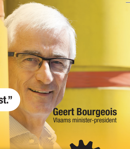
Geert Bourgeois Vlaams minister-president

“Deze Vlaamse Regering beslist, hervormt en tekent het Vlaanderen van de toekomst.”