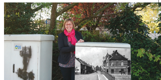
Nutskasten in een nieuw kleedje p. 3