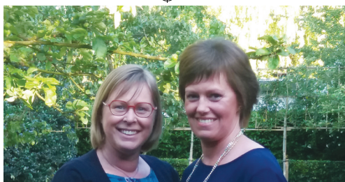
Aandacht voor personen met een beperking p. 2